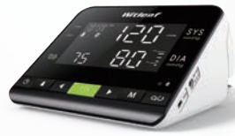
> WitBP6016A: 袖带收纳 背光显示 大屏幕