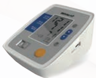
> WitBP6012A: 小尺寸

WitBP6016系列是惟拓力家用健康血压测量解决方案的重要组成部分，相较于WitBP6012系列，该设备屏幕尺寸增大，新增背光显示及袖带收纳的功能。可以有效运作3年，通过了严格的电气安全测试和可靠性测试，是家用血压测量的理想之选。