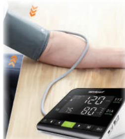
○ 舒适智能加压技术