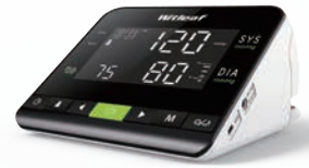
> WitBP6016B: 蓝牙 袖带收纳 背光显示 大屏幕